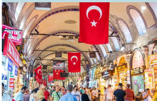
Día 7 Dic. - Estambul: “Cuerno de Oro”

Desayuno. Salida hacia la Iglesia de Hierro de San Esteban, iglesia ortodoxa búlgara en una ciudad turca, relacionada con la lucha por la independencia eclesiástica de los años 30 y 40 del siglo XIX, siendo la única iglesia ortodoxa de hierro del mundo. A continuación, nos dirigiremos hacia los pintorescos y coloridos barrios de Fener y Balat, protegidos por la Unesco y están considerados los primeros asentamientos de la antigua Constantinopla. Después nos visitaremos la Catedral de San Jorge, es la quinta iglesia de Constantinopla que alberga el patriarcado ecuménico desde el siglo XV. Anteriormente un convento para monjas ortodoxas, fue convertido en las oficinas patriarcales por el patriarca Mateo II (1598-1601). Al final visitaremos el Gran Bazar, con más de 4.500 tiendas que se agrupan en zonas especializadas en diferentes productos: joyería, ropas, entre otras cosas. Aquí termina la excursión. Tarde libre. Opcionalmente podrán realizar la excursión “Clásica”, consultar detalles con su guía en destino. Alojamiento.